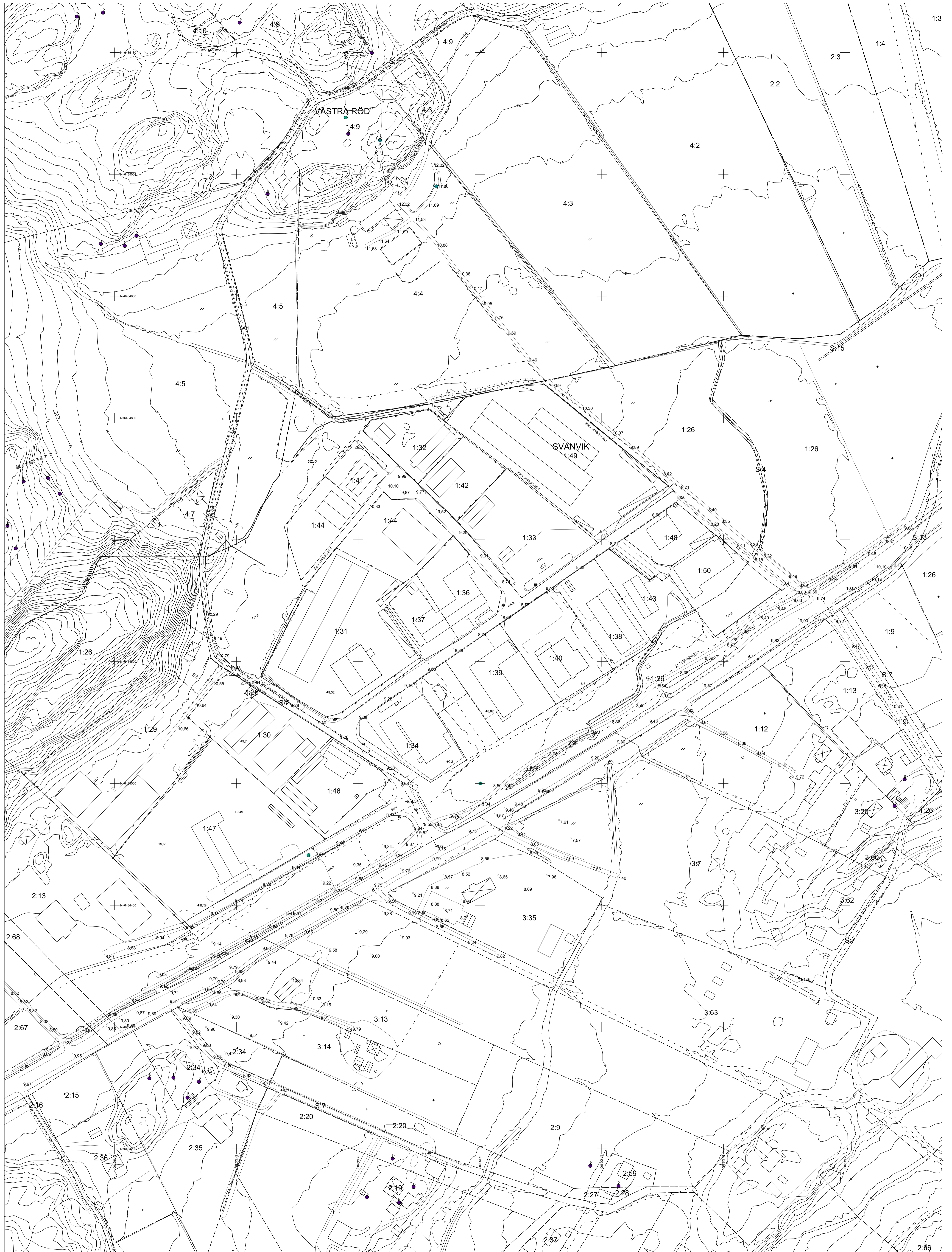
Grundkarta för Svavik 1:26 m.fl. GRUNDKARTEBETECKNINGAR