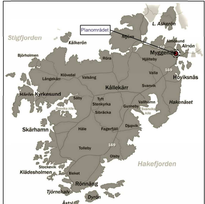
Orienteringskarta Granskningshandling, normalt planförfarande

Utredningar: - Geoteknisk undersökning inför detaljplan Ävja/Mällby 1:29, Almösund, Tellsted i Göteborg ABm 2010-10-06 - Bullerutredning (underlag framtaget i samband med tätortsstudien Tätortsstudie Almösund, Myggenäs och Almön, Tjörns kommun, Bullerutredning vägtrafik, 2010-09-13 ÅF) - Trafikutredning, Almösund, Tjörns kommun Trafikanalys och trafikutformnings förslag för detaljplan Ävja 1:29 och Mällby 1:29 mfl, 2015-12-10, Norconsult