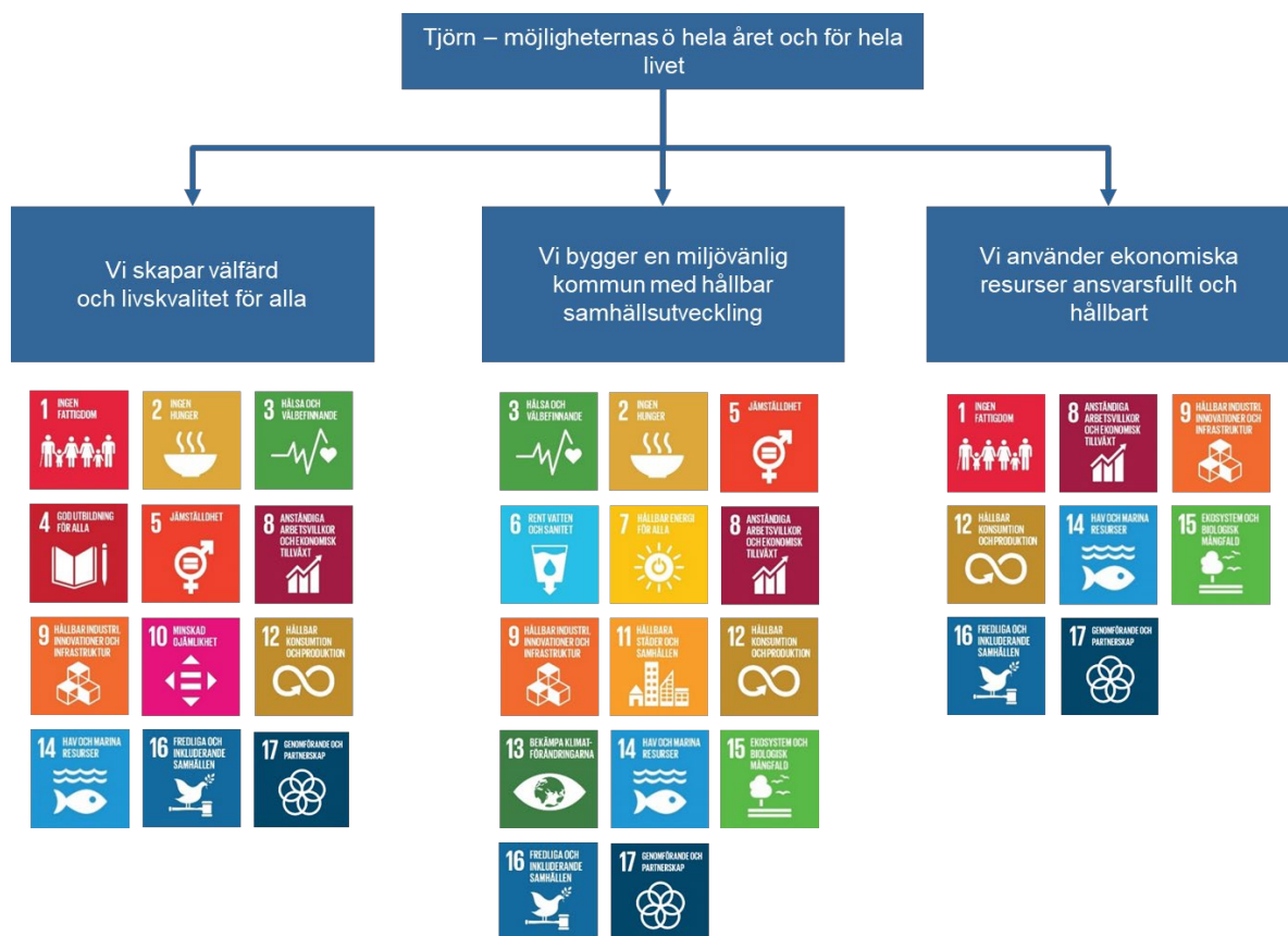
Figur 2 De 17 hållbarhetsmålen i Agenda 2030 sorterade under respektive strategiskt område

Figur 2 visar hur de 17 hållbarhetsmålen i Agenda 2030 kan sorteras under de tre strategiska områdena som Tjörns kommun har. Som man kan se i figuren kan många hållbarhetsmål kopplas till mer än ett av de strategiska områdena.