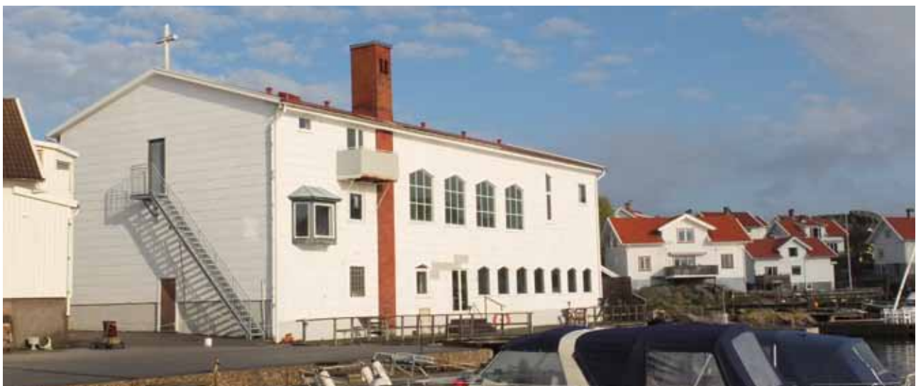
Byggnaden som idag används som Betelförsamlingens gudstjänstlokal byggdes om från sillberedningsfabrik till gudstjänstlokal 1958.