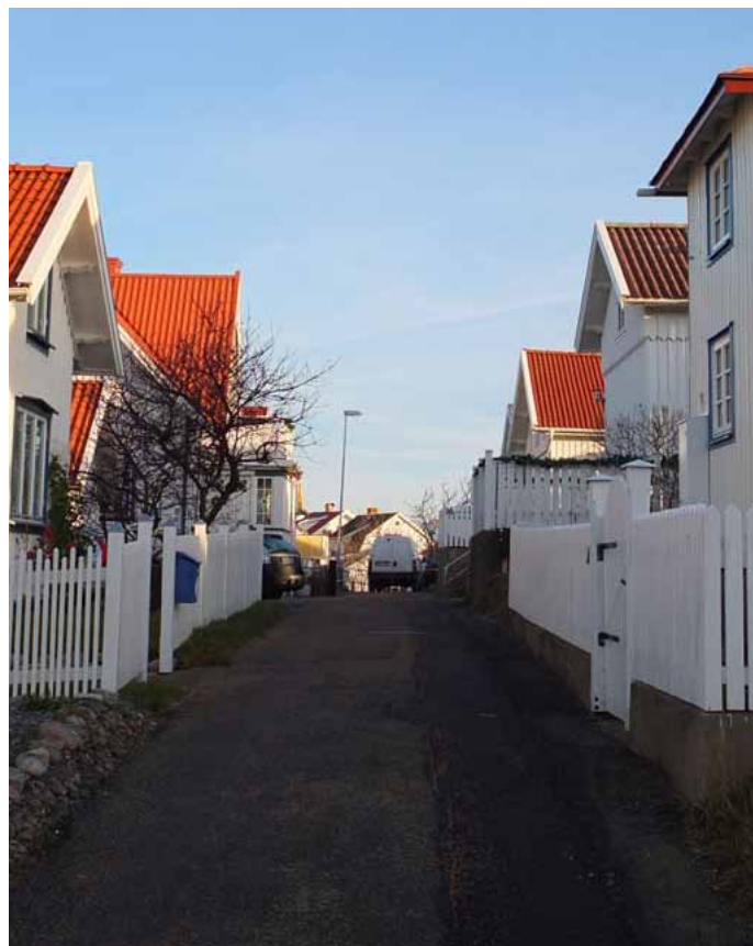
Brunsvägen, en av Koholmens raka gator med äldre bebyggelse uppförd sent 1800-tal eller tidigt 1900-tal.

Bebyggelsen på Koholmen visar prov på de mer ordnade planeringstraditionerna som blev gällande under senare delen av 1800-talet då raka gator i rutnätssystem vad de gällande idealen. Planeringen av Koholmens bebyggelse har alltid kommit att följa gällande planeringsideal vid tiden för bebyggelsens uppkomst. Vad gäller den äldre bebyggelsen ligger skillnaderna mellan Klädesholmen och Koholmen således i byggnadernas placering snarare än i själva utförandet. Då Klädesholmens byggnader följer fiskelägenas traditionella gytter av bostadshus uppförda enligt ett oregelbundet mönster ser vi på Koholmen raka gator där husen står uppförda enligt ett genomtänkt och rationellt mönster. Denna tydliga skillnad i planeringen av bebyggelsen mellan de båda holmarna speglar ytterligare en "årsring". Denna "årsring" visar på behovet av en vidare etablering av konservfabriker såväl som behovet av fler bostäder. Skillnaden i bebyggelsemönstren kan sägas spegla Klädesholmen och Koholmens vidare utveckling mot en dominerande ställning inom Sveriges fiskeberedningsindustri, ett bebyggelsemönster med högt ekonomihistoriskt såväl som arkitekturhistoriskt värde.