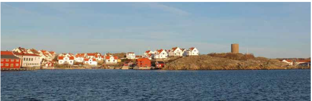
Koholmen, vy från söder.