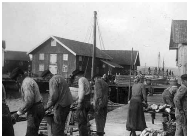
Isbjörnens konservfabrik under 1910-talet.