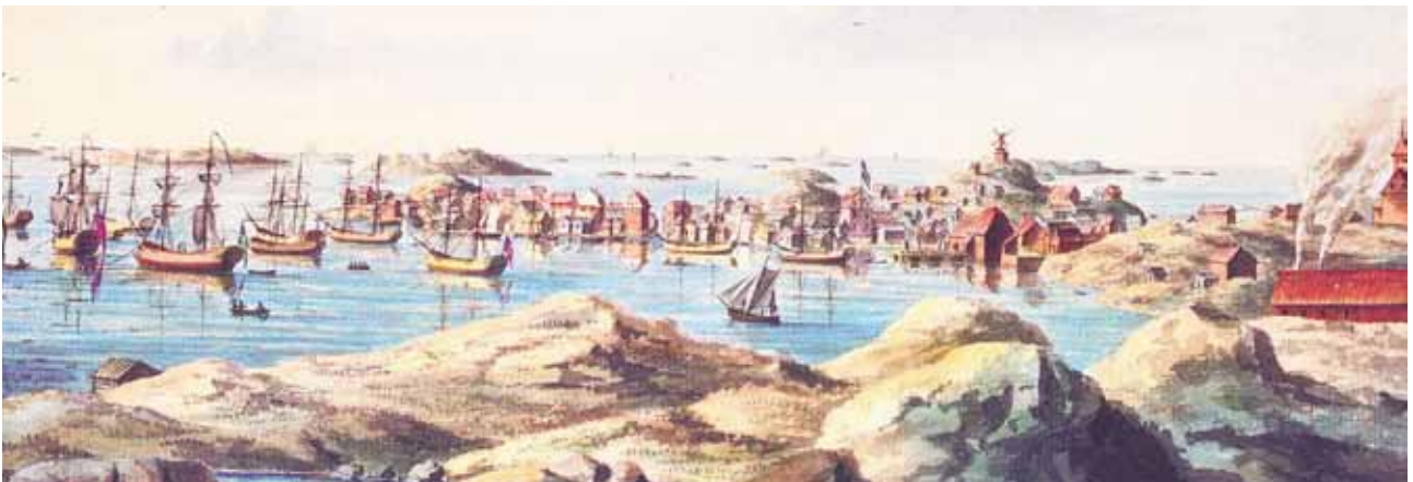
Justus F Weinbergs målning från 1794 är ett viktigt dokument, till höger i bild skimtar man bebyggelse på Koholmen med kyrkan på höjden.