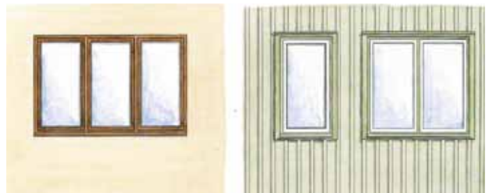
En-, två- och treluftsfönster var gällande under 1940-talet.

Olikfärgat gavelavslut, mycket populärt under 1970-talet, ett karaktärsdrag som plockats upp i de tilläggsisolerande plåtfasaden vid "vindgatorna". Illustrationerna på denna sida kommer från "Så byggdes villan" Björk m.fl.