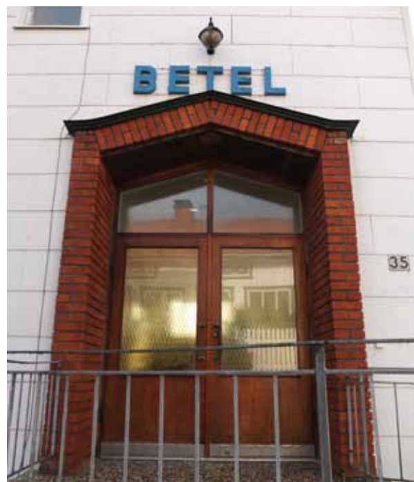
Betelkyrkans monumentala huvudentré inramad med en murad, spetsbågad portik.