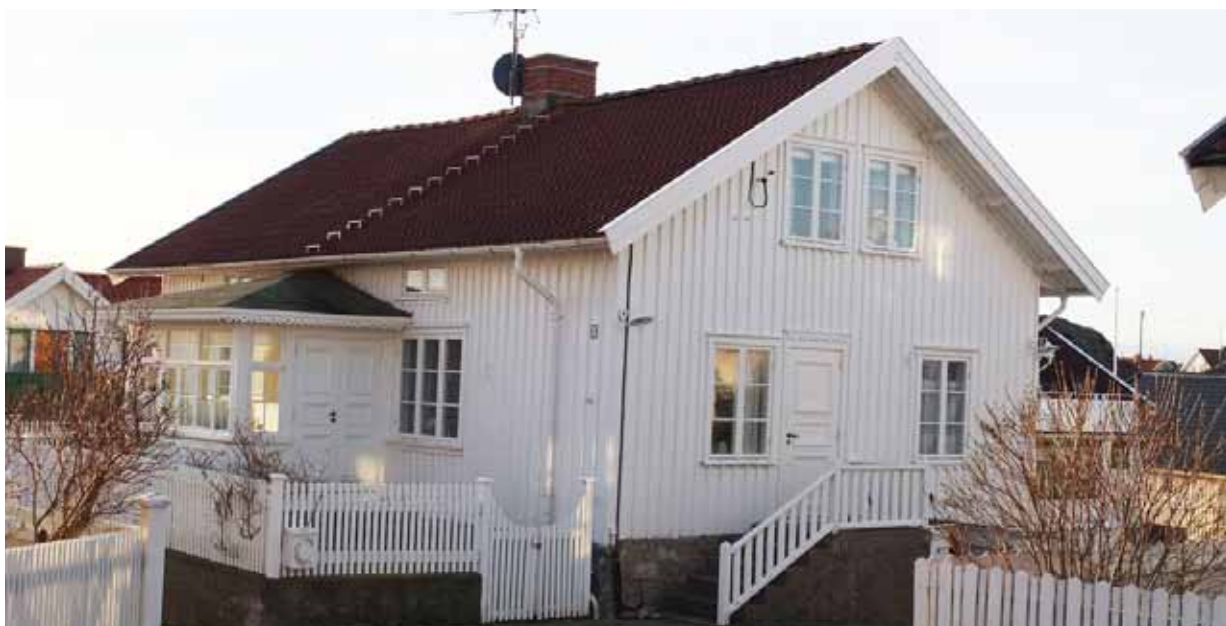
Ett äldre dubbelhus på Kyrkvägen 5, byggår 1890. Byggnaden har många äldre snickeridetalljer och en del bevarade originalfönster.