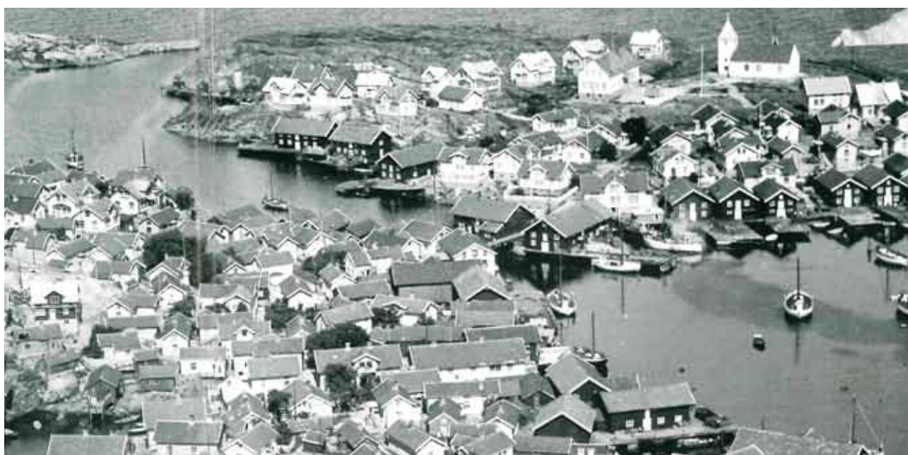
Flygbild över Klädesholmen och Koholmen, troligen tagen på tidigt 1940-tal.

Först på 1960-talet öppnades färjeförbindelse mellan Koholmen och Bockholmen på tjörnsidan och i samband med detta drogs bilvägar fram på öarna. År 1984 invigdes den av efterlängttade bro som kom att ersätta bilfärjan. Bilfärjan hade varit igång sedan 1960-talet då den ersatte personfärjan som gick från Tjörn. Broförbindelse mellan Klädesholmen och Koholmen har en lång historia, den första bron mellan holmarna byggdes 1895. 1941 invigdes en klaffbro som då ersatte en slags rullkonstruktion. 1984 ersattes klaffbron av en fast bro som byggdes mellan öarna.