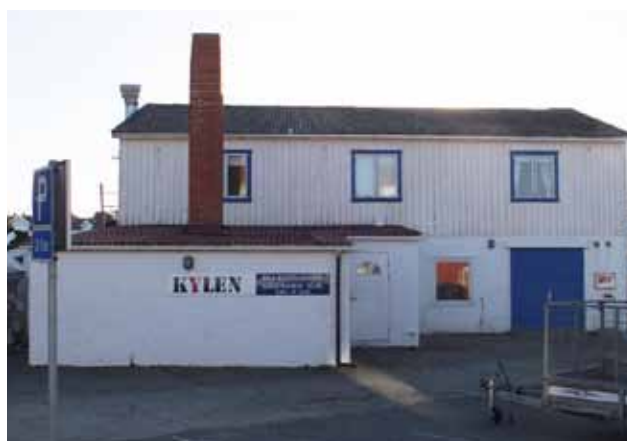
"Kylen" Koholmen 1:135, används för närvarande som restaurang.