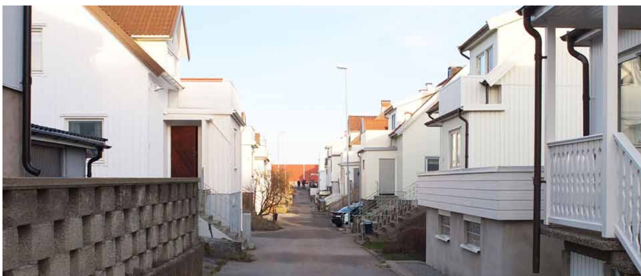
Östanvindsvägen med huvudsaklig 1940-talsbebyggelse.