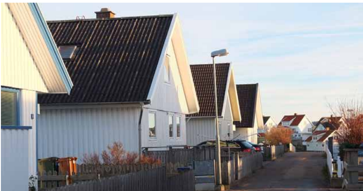
Tidstypiska villor från 1970-talet vid Bäckerövägen.