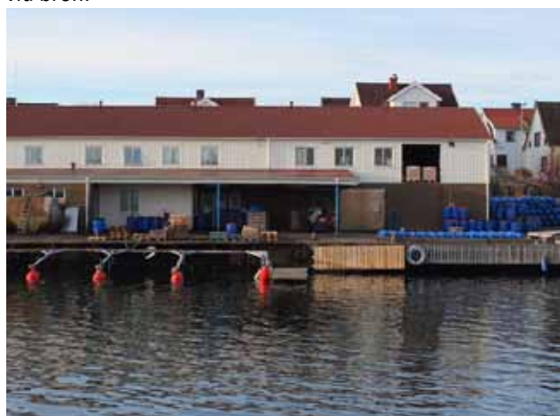
Bråses konserver är också en del av Klädesholmen Seafood.