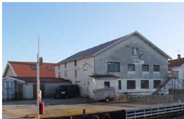
Isbjörnens konservfabrik, förändrad både interiört och exteriört under årens lopp.