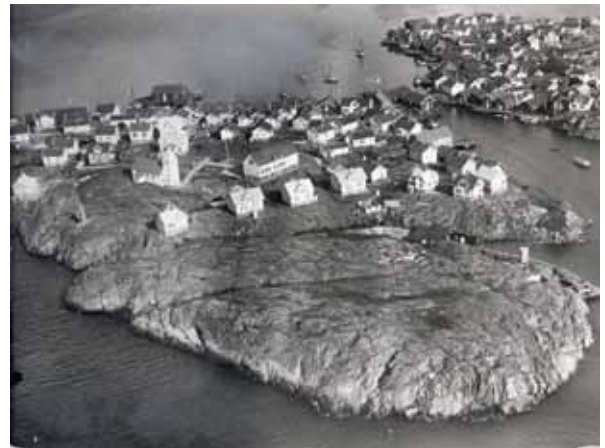
Flygbild över Koholmen. Kyrkan, skolan och den äldre bostadsbebyggelsen syns tydligt i bild. Troligen är bilden tagen på 1940-talet.

Den vanligaste byggnadstypen i utredningsområdet är det Västsvenska dubbelhuset. I Bohuslän började man bygga dubbelhus några decennier in på 1800-talet, under de högkonjunkturer som följde på sillperioderna vid mitten och senare delen av århundradet passade befolkningen i kustsamhällena på att ”bygga dubbelt” när de i stor omfattning byggde om eller byggde nytt. Och ännu i början av 1900-talet