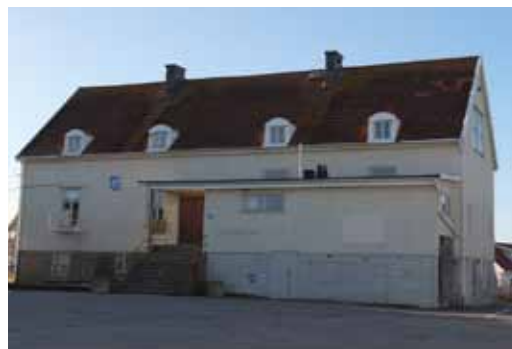
Skolbyggnadens östra fasad med en utbyggnad från 1970-talet.