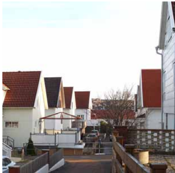
Byggnaderna ligger anlagda i linje på raka gator på Västän-, Östan- och Nordanvindsvägen.

Byggnaderna som uppförts på Nord- Väst- och Östanvindsvägen samt Industrivägen är alla präglade av modernismens tongångar. Vita fasader med förhållandevis få utsmyckande detaljer och stora perspektivfönster utan spröjsindelning är en vanlig karaktär. Byggnaderna här är i huvudsak uppförda under 1940-talet. Många av byggnaderna är förändrade med tilläggsisolerade plåtfasader eller nyligen uppförda träfasader i sekelskiftesutförande. En tidsperiod där förändringarna har varit påtagliga är 1960-70-talen då de flesta byggnaderna försetts med tilläggsisolerande fasader och ny färgsättning i vitt och mörkbrunt. På flera byggnader har de översta gavelpartierna försetts med mörkbrun fasad, ett karaktärsdrag som var vanligt under 1970-talet. Enstaka byggnader har ursprunglig eternitfasad bevarad, ett karaktärsdrag som är kulturhistoriskt intressant. Ett fåtal byggnader har också en tidstypisk färg-