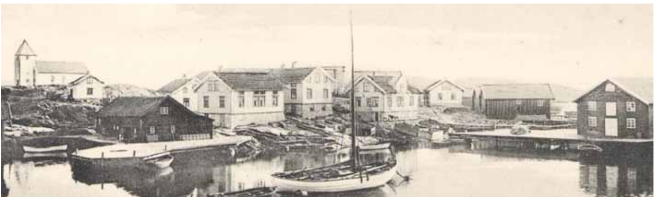
En äldre bild över Koholmen, troligen kring sekelskiftet, bebyggelsen vid Guldsmedsviken framträder tydligt. Isbjörnens konserverfabrik är tydligt synlig till höger i bild.