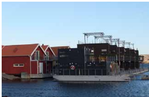
En del av bebyggelsen vid hotell-och konferensanläggningen Salt och Sill.