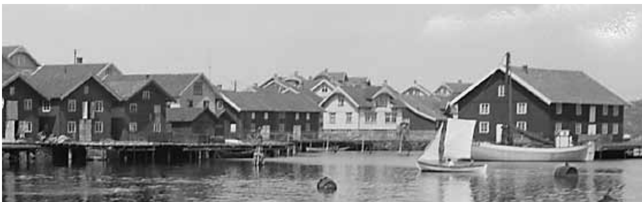
Konserverfabrikerna på sydöstra Koholmen i början av 1900-talet.