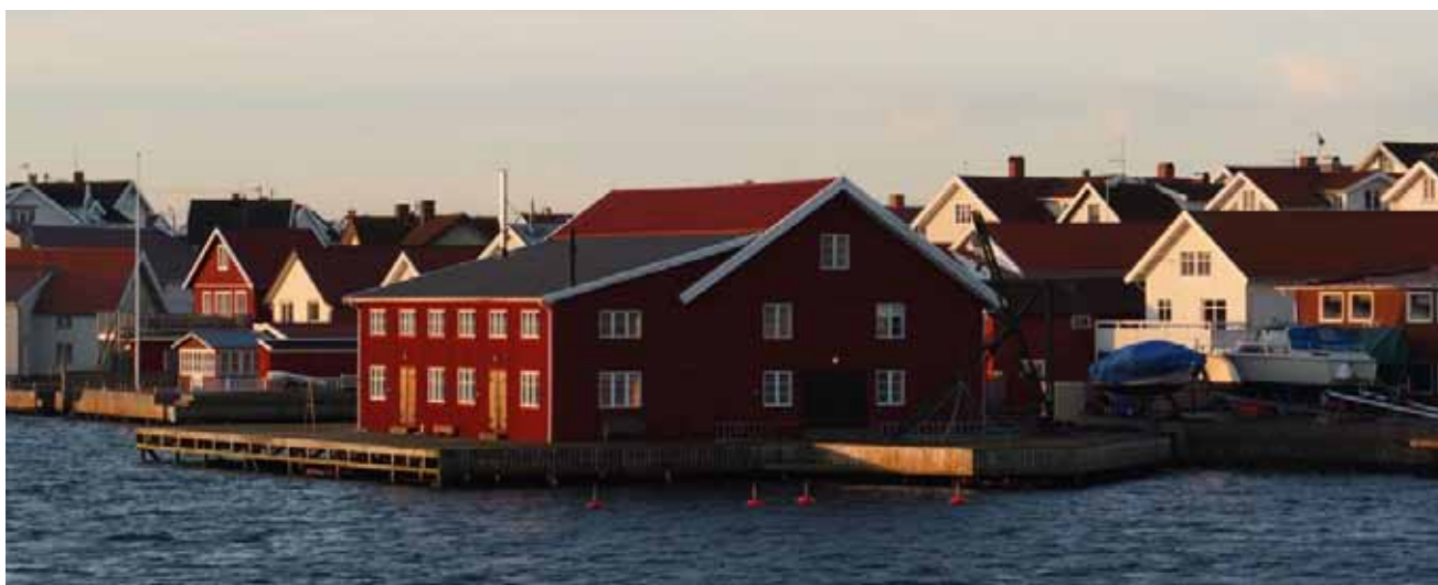
Den stora andelen konservfabriksbyggnader på Koholmen och Klädesholmen är unik för västkusten, en företeelse som visar på lång kontinuitet och högt kulturhistoriskt värde.