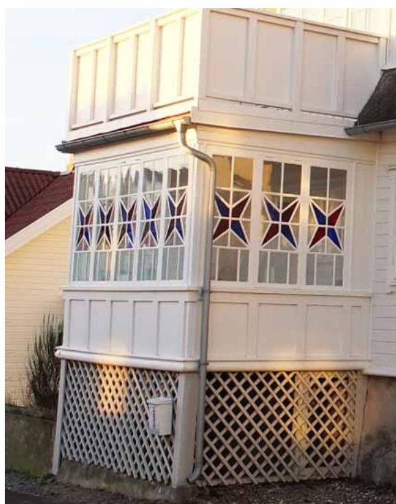
Äldre och ursprungliga verandor med bevarade fönsterspröjs är en viktig del i den kulturhistoriska karaktären.