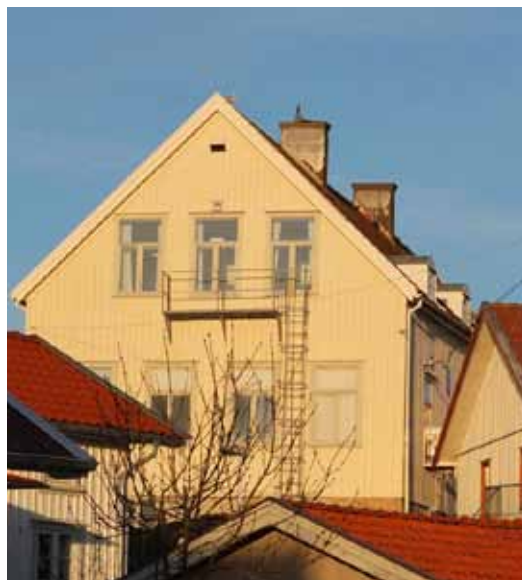
Skolbyggnaden är uppförd på en av öns höjdparter, traditionellt placerad invid kyrkan.

Förändringarna från sekelskiftesbebyggelsen kom främst att ligga i nya typer av fasadmateriål såsom eternit. De vid sekelskiftets så populära pröjsade fönsterbågarna kom att ersättas med stora perspektivfönster eller en- och tvåluftsfönster, helt utan spröjs. Eterniten skulle ju vara