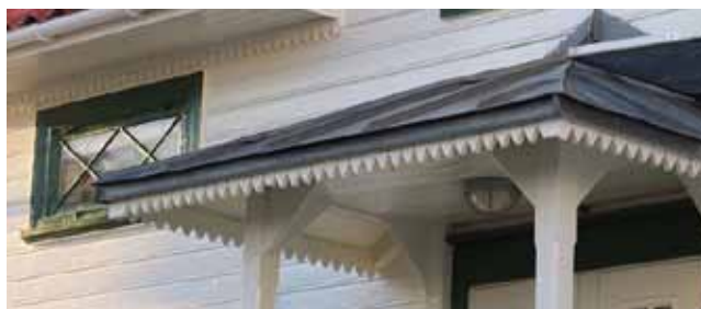
Dekoreraende snickeridetaljer på takfot och profilerade fönsterfoder. Guldsmedsviken 1.