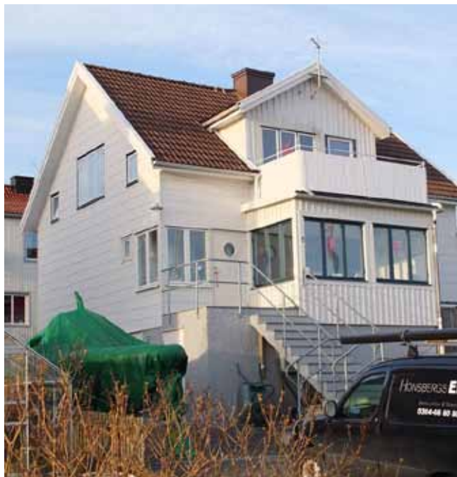
Ett modernistiskt formspråk med bevarade fönster och eternitfasader är viktiga för öns arkitektoniska uttryck och visar på samhällets starka livskraft in i modern tid.