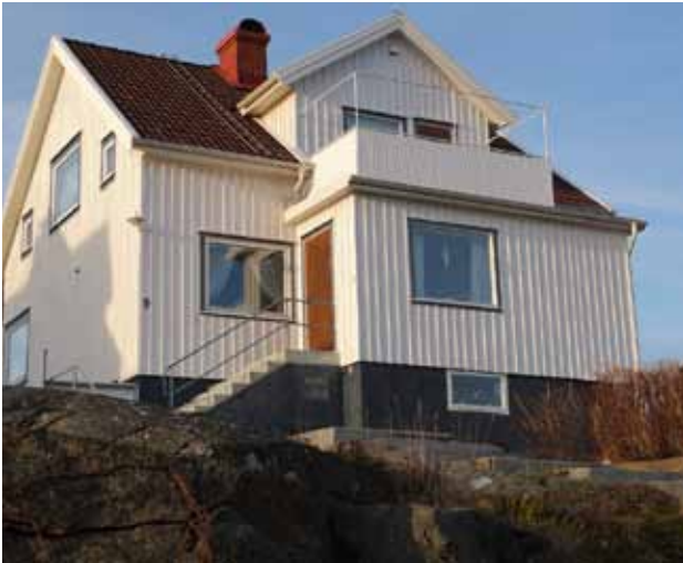
Det modernistiska formspråket som var gällande under 1940-50-talen är av stor vikt för Koholmens karaktär, ett bevarande förstärker Koholmens kulturhistoriska kvaliteter.