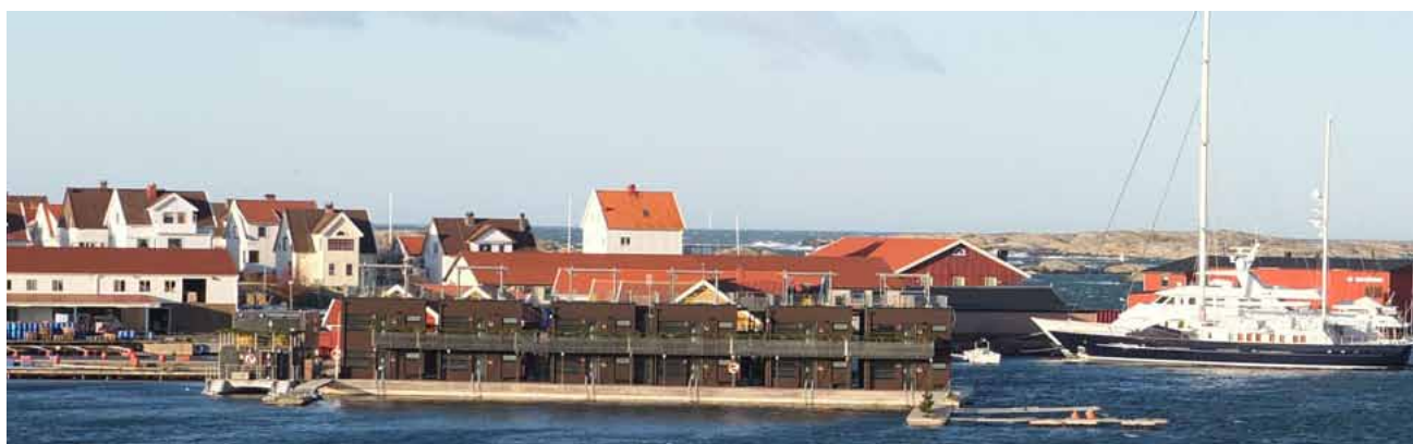
Fabriksbyggnadernas stora och enkla volymer kan vara vägledande i kommande ombyggnadsprojekt. Ett modernt formspråk bör även fortsättningsvis vara vägledande vid en eventuell utveckling av konferensverksamheten vid Salt och Sill.