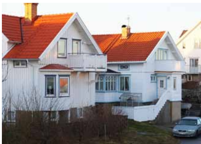
Dubbelhus vid Lilla Karishamsvägen.