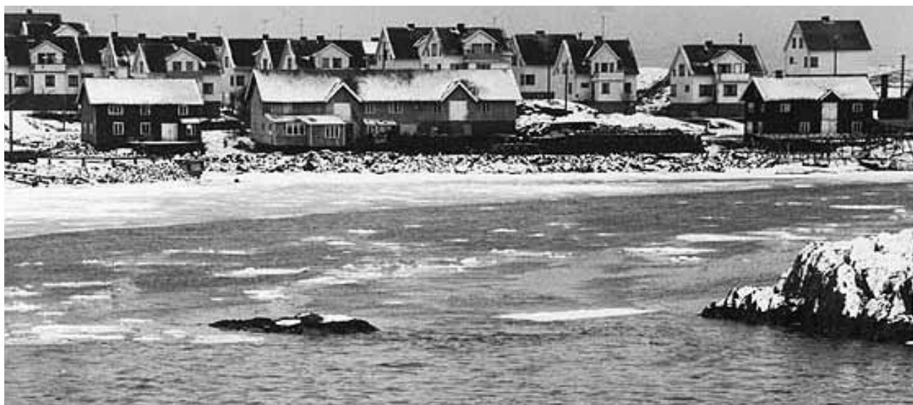
Bild över nordöstra stranden vid mitten av 1960-talet. Här syns de fabriksbyggnader som var uppförda före de mer storskaliga industribyggnaderna uppfördes. Bostadsbebyggelsen på "vindgatorna" i bakgrunden.