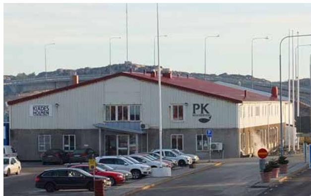
En av industribyggnaderna som idag tillhör Klädesholmen Seafood AB, utgör ett landmärke när man närmar sig ön via bron.