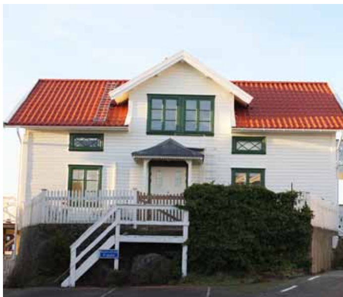
En välbevarad byggnad på Guldsmedsviken 1, snickeridetaler och korspröjsade fönster i originalutförande.