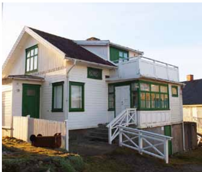
Bevarade snickeridetaler och originalfönster är ovanliga på den äldre bebyggelsen på Koholmen, det är viktigt att de som är kvar bevaras. Guldsmedsviken 3, byggd 1911.

säger också något om vilket stort antal barn som behövde utbildning här vid 1920-talets slut. Skolbyggnaden har med sitt välbevarade yttre, höga läge invid kyrkan ett högt kulturhistoriskt värde som både är av arkitekturhistoriskt- och socialhistoriskt intresse.