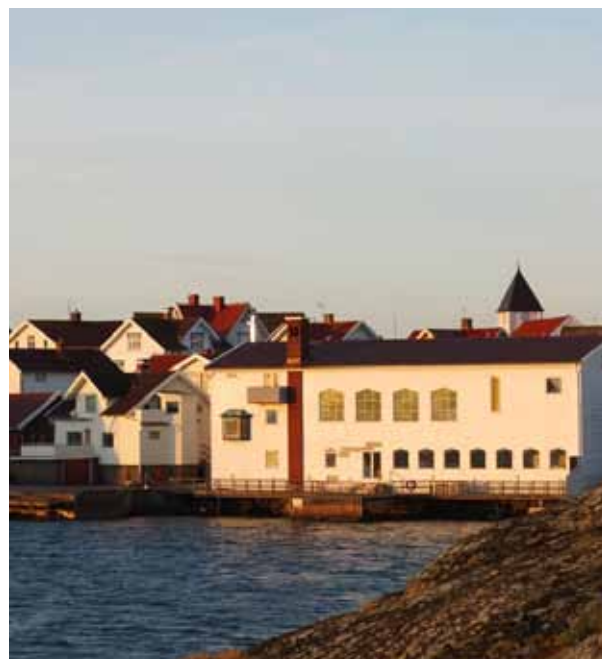
En av de gamla konservfabrikerna byggdes om till kyrka, Betelkyrkan flyttade in 1958.

strivägen är ett tydligt exempel på detta. Jämt Kungshamn, i Sotenäs kommun, är Koholmen det samhälle som har högst andel av typhusbebyggelse längs Bohuskusten. Detta är ett tecken på Koholmens fortsatt starka betydelse inom fiskeberedningen och god tillgång på arbetstillfällen in i modern tid. De moderna typhusen och dess ursprungliga karaktär är av stor betydelse för Koholmens kulturhistoriska karaktär.