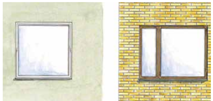
Pivåhängda perspektivfönster och asymmetriska fönster var vanliga under 1950-talet