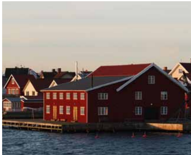
"Svarta Skär", en fabriksbyggnad vars exteriöra karaktär är välbevarad. Ursprunglig fönstersättning och fönstrens utformning är viktiga detaljer för en bevarad karaktär.

Magasinet uppfördes 1914. Byggnaden har vid någon tidpunkt byggts ut mot sydost men i stort har den behållit sin ursprungliga karaktär. Byggnaden är ett bra exempel på hur en konserverfabrik kan bevara sin ursprungliga karaktär efter en omfattande interiör och exteriör renovering. Byggnaden saknar helt byggnadsdetaljer och andra tillbehör som förknippas