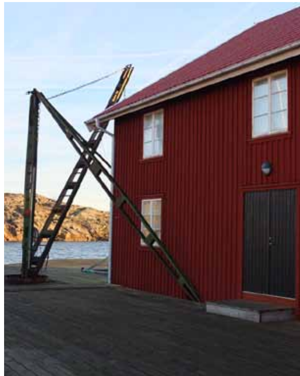
Äldre konserverfabrik ombyggd till bostad. Enkelt formspråk och bevarad kran ger byggnaden en fortsatt karaktär av ekonomibyggnad.

Koholmen har en förhållandevis hög andel byggnader som är eller var avsedda för konserverberedning. Långa sträckor av öns stränder är bebyggda med äldre eller yngre f.d. konserverfabriker. De äldre byggnaderna är i huvudsak belägna på öns södra och sydöstra stränder medan de moderna, storskaliga fabriksbyggnaderna är uppförda på öns nordöstra delar. Den äldre fabriksbebyggelsen har över lag en traditionell utformning med trä- eller plåtfasader placerade med gavlarna ut mot vattnet. Fönstren är relativt få till antalet och utförda utan eller med enkla foder. Flera av dessa byggnader används idag som bostäder. Byggnaderna är numera målade i både ljusa, vita eller gråvita toner men även stort inslag av falurött finns. Historiskt sett var den faluröda slamfärgen förhärskande. De äldre magasins- och