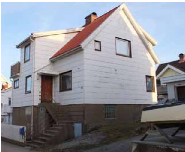
Eternitfasader är en viktig del i bebyggelsens karaktär på Koholmen, värd att bevara.