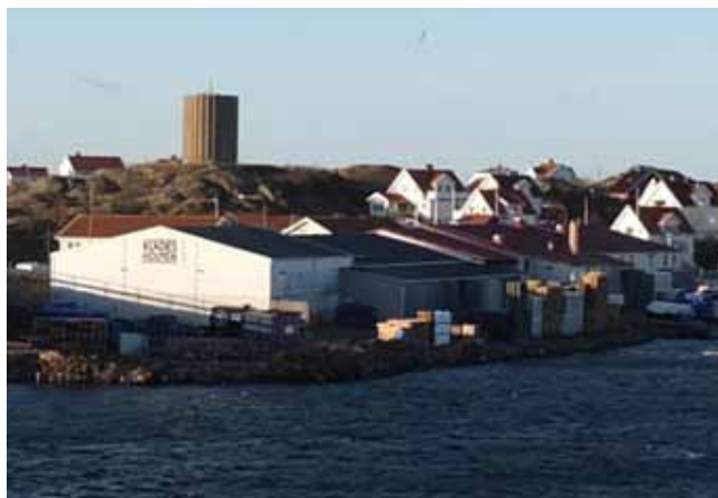
Vattentornet syns från flera väderstreck och har betydelse som landmärke även ut mot havet. Klädesholmen Seafoods konservindustri syns i förgrunden. Bilden är tagen från öster.

De flesta moderna konservfabrikerna på öns norra del är de flesta uppförda under 1980-talet. Bebyggelsen präglas främst av storskaliga industribyggnader uppförda med enkla plåtfasader och svagt sluttande sadeltak. Byggnaderna i sig har inga kulturhistoriska bevarandevärden men visar på ett tydligt sätt fiskeberedningsverksamhetens fortsatt stora betydelse för Koholmen och Klädesholmen. Miljön på denna del av ön är präglad av mer storskalig industribebyggelse.