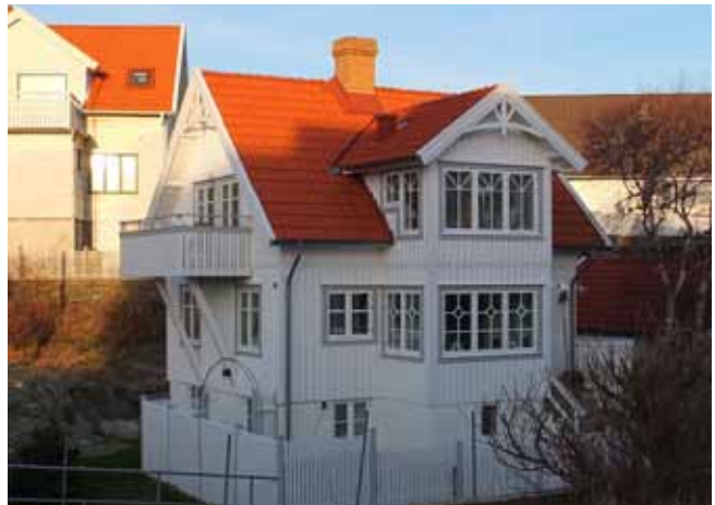
Hus byggt 1935 ombyggt i sekelskiftesstil.

Mycket av de förändringar som genomförs i området resulterar i att byggnadernas fasader byggs om i traditionell stil från sekelskiftet 1800-1900. Detta bidrar till en förvanskning av området då bebyggelsens autentiska uttryck försvinner.