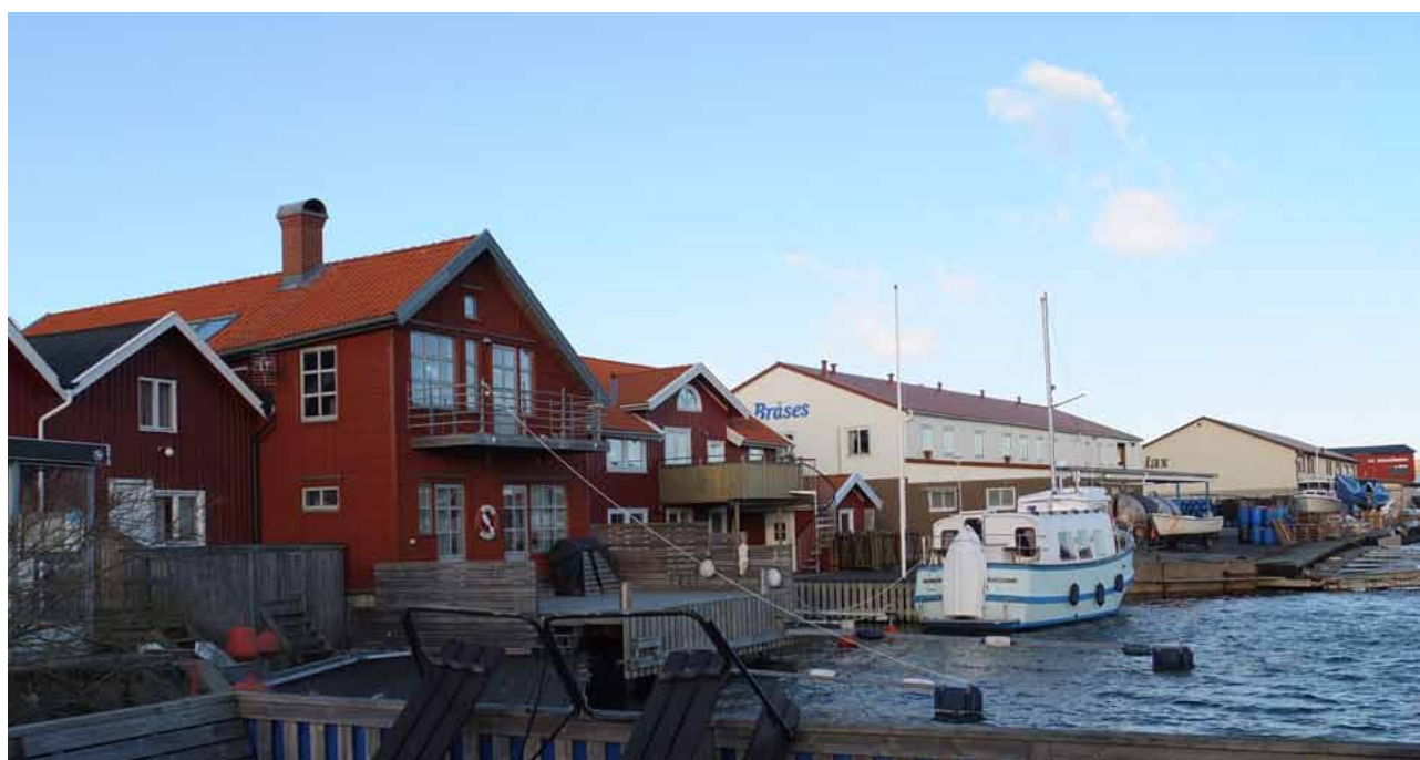
Längs Koholmens nordöstra strand ligger flera konservfabriker, både verksamma och nedlagda. De större industribyggnaderna uppfördes på 1980-talet.

Klädesholmen och Koholmen syns tydlig från havet. Väster om öarna passerar mycket båttrafik. Öarnas siluett är karaktäristisk och är lätt att identifiera till havs. Bebyggelsens ljusa färgsättning, med de spetsiga sadeltaken avtecknar sig mot himlen, berget och havet. Kyrkan och vattentornet är viktiga landmärken för Koholmen och viktiga beståndsdelar i identifieringen från havet. Det är viktigt att öarnas specifika siluettverkan bevaras som en del i Koholmen och Klädesholmens identitet.