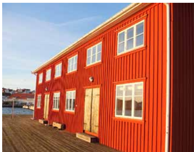
"Svarta Skär", enkla fönsterfoder, enkla bräddörrar bidrar till ett bevarande av fabrikskaraktären. Enkla lockpaneler målade med faluröd slamfärg förstärker karaktären.