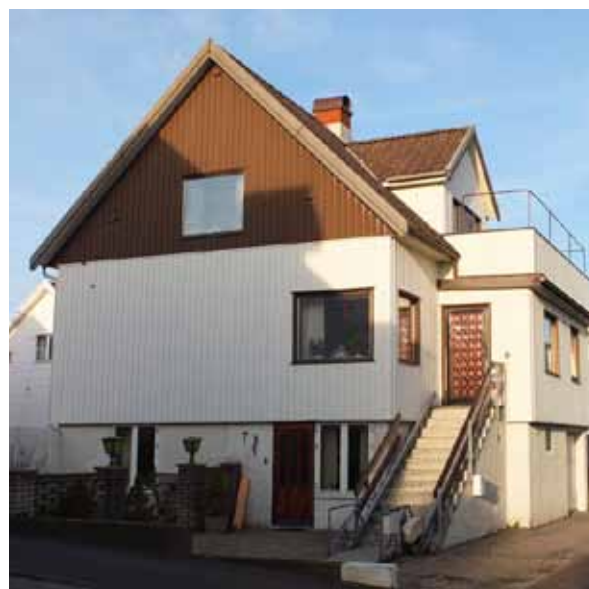
Östanvindsvägen nr 7, byggnad renoverad troligen vid 1960-talets slut eller 1970-talets början.