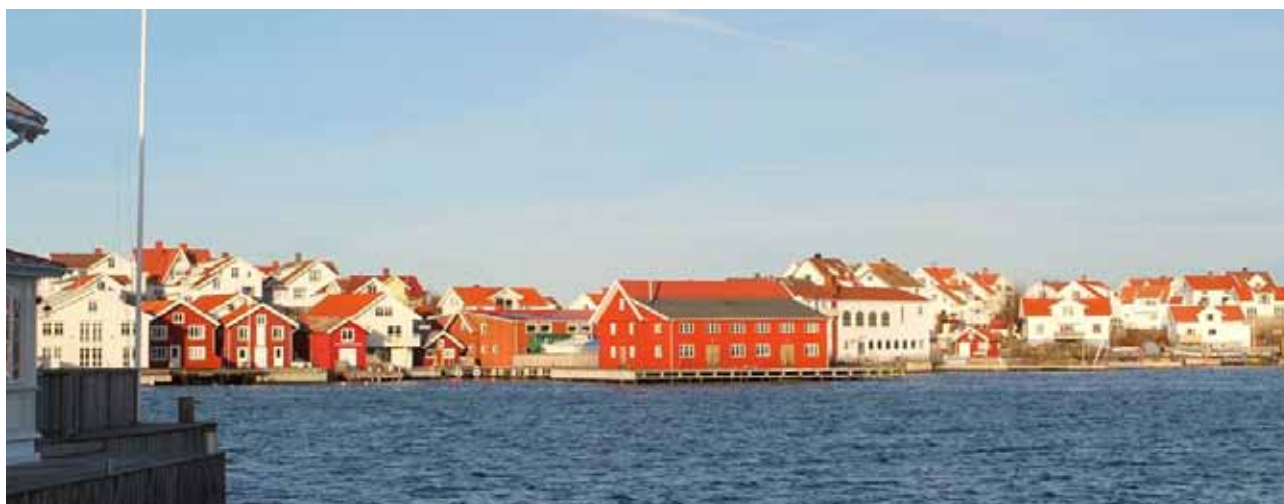
Koholmens sydöstra strand.