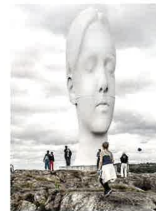
Skulpturen Anna av konstnären Jaume Plensa.

Kanske är det mixen av det urgamla kulturlandskapet, med ett 90-tal synliga järnåldersgravar, de betande fåren och de moderna skulpturerna av ledande konstnärer från hela världen, som gör ett besök i Pilane lika spännande varje år.